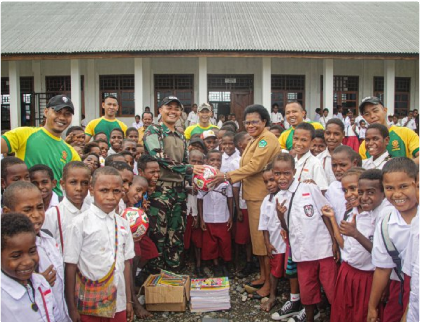
Foto: Satgas Pamtas Mobile RI-PNG Yonif 503/Mayangkara mendistribusikan sarana belajar ke SD Gabungan Distrik Kenyam, Kabupaten Nduga, Papua, pada Minggu (09/02/2025).