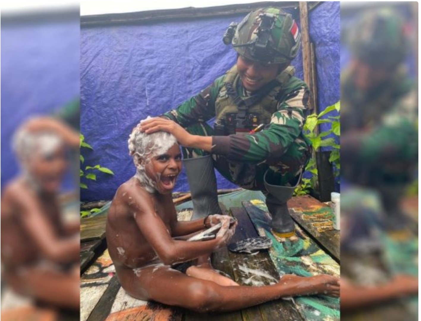
Foto: Saat Satgas Pamtas Mobile RI-PNG Yonif 503/Mayangkara Koops Habema Mengajarkan Anak-anak Menjaga Kebersihan Dengan Mandi Air Bersih di Pos Batas Batu, Kecamatan Batas Batu, Kabupaten Nduga, Papua Pegunungan, Kamis (04/07/2024).

NDUGA- Satgas Pamtas Mobile RI-PNG Yonif 503/Mayangkara Koops Habema