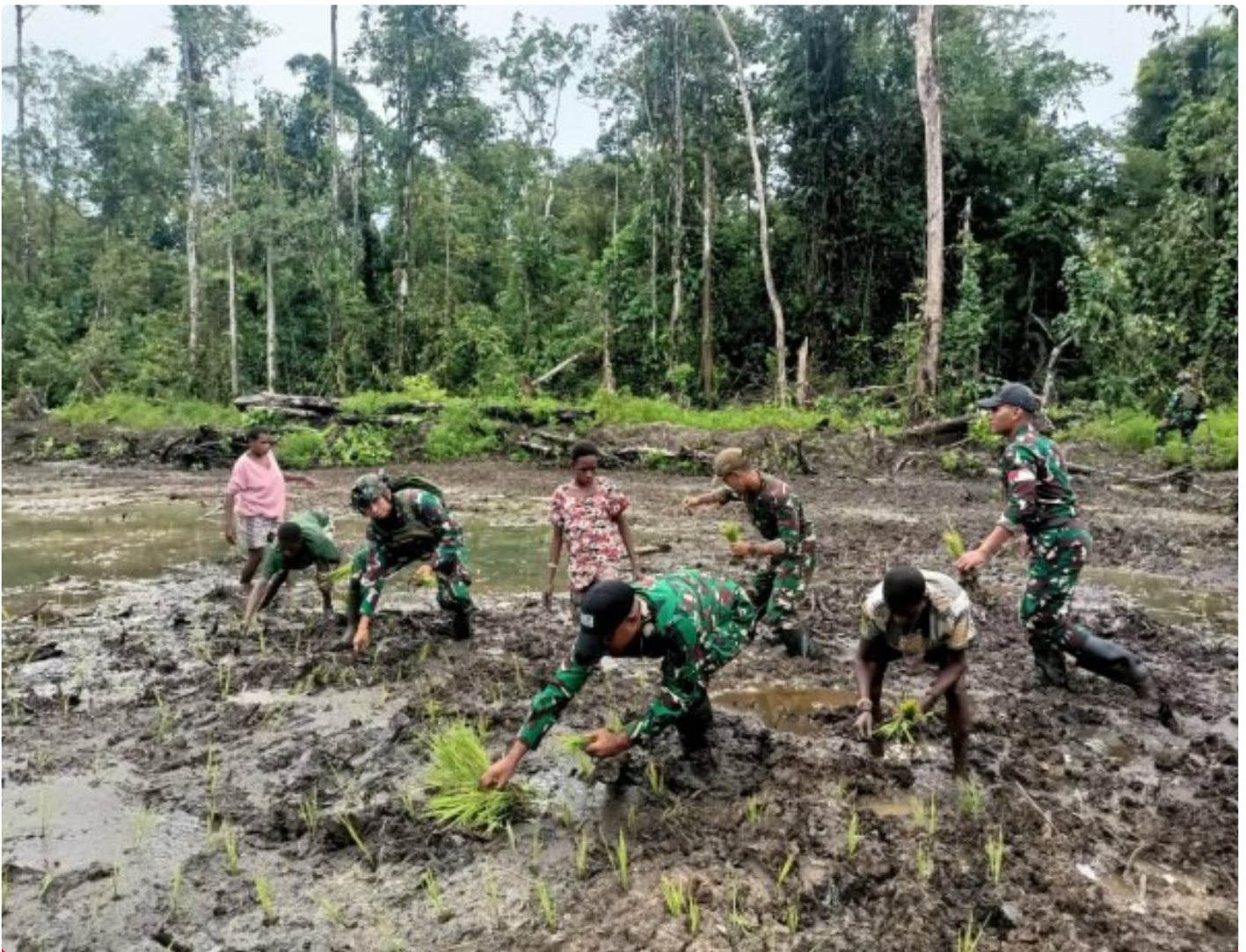
Foto: Satgas Pamtas Mobile RI-PNG Yonif 503/Mayangkara menggagas program ketahanan pangan yang melibatkan langsung warga Kampung Mumugu, Distrik Krepkuri, Kabupaten Nduga, Selasa (07/01/2025).